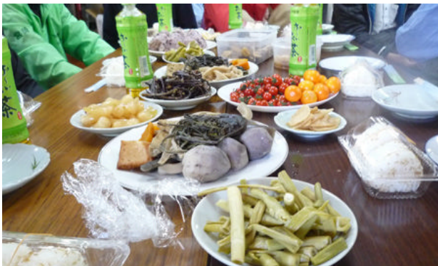
一番手前はイタドリの酢漬け

おねっこ祭りは、もう10回目となりました。宮崎グリーンヘルパーの会は1回目から参加しています。