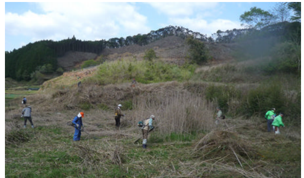
参加人数が多く、早めに終わりました